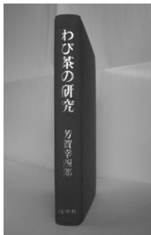
『わび茶の研究』 芳賀幸四郎著